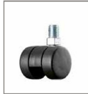
Kunststoff-Doppelrolle (2 cm höher)