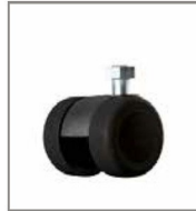
Parkettrolle (2 cm höher)