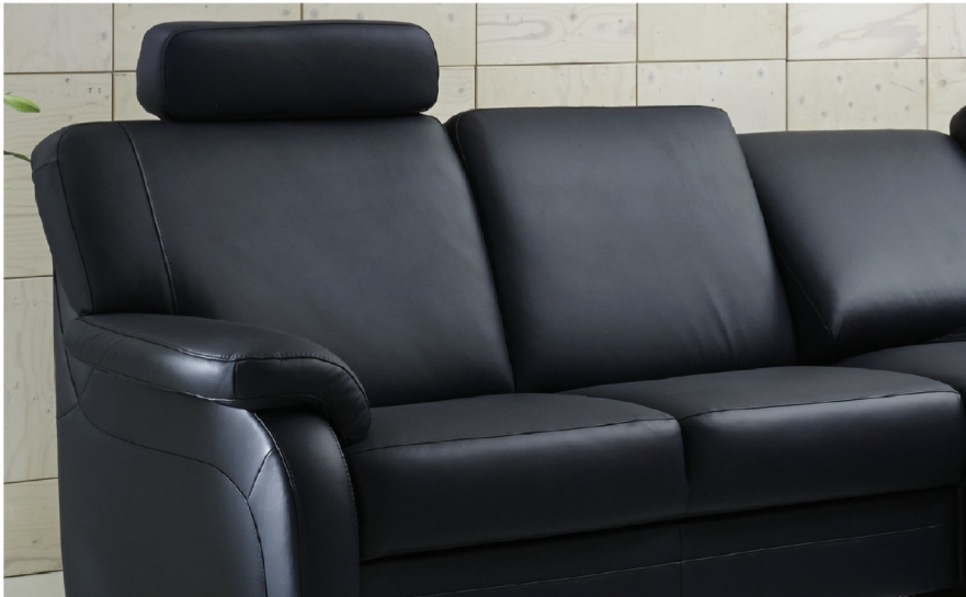
Element OHNE WallAway-Funktion an der Armlehne: