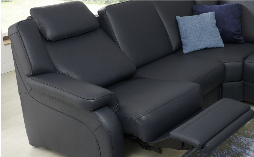
Element MIT WallAway-Funktion an der Armlehne: