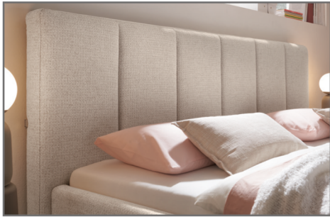
KT 1 Kopfteil mit senkrechten Einzügen