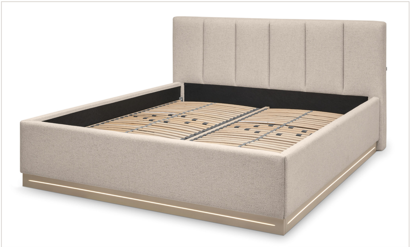
Abb. 2957-87-5000 , NOELLE beige Nr. 30, Kopfteil KT 1 mit senkrechten Einzügen, Bettgestell inkl. Bettkasten und Federholzrahmen, Sockel S 3 sandfarbig, Liegefläche 180 x 200 cm