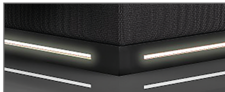
S 2 MDF foliert, schwarz inkl. LED-Beleuchtung, warm-weiß