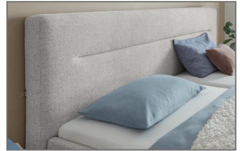
KT 3 Kopfteil mit Quereinzug