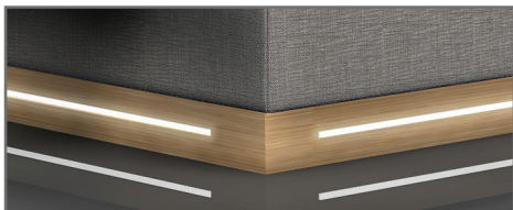
S 1 MDF foliert, eichefarbig inkl. LED-Beleuchtung, warm-weiß