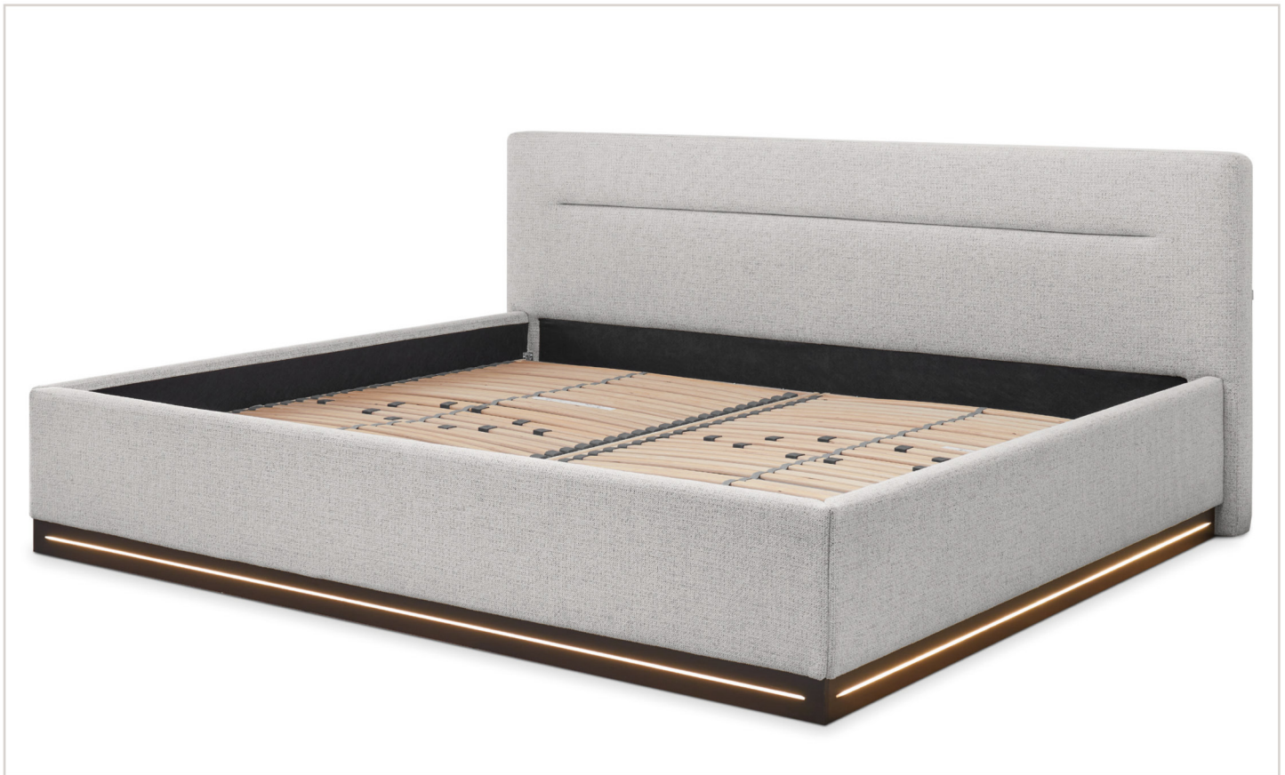
Abb. 2961-88-8000 , NOELLE hellgrau Nr. 04, Kopfteil KT 3 mit Quereinzug, Bettgestell inkl. Bettkasten und Federholzrahmen, Sockel S 2 schwarz, Liegefläche 240 x 200 cm