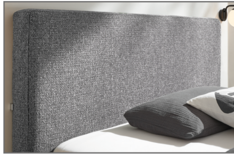
KT 2 Kopfteil glatt