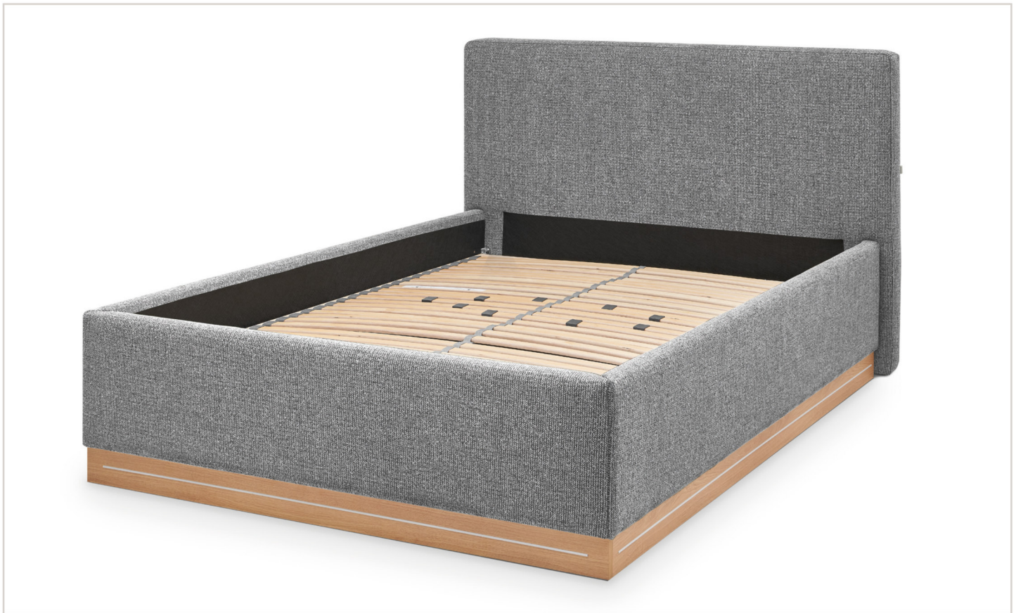
Abb. 2959-89-3000 , NOELLE grau Nr. 09, Kopfteil KT 2 glatt, Bettgestell inkl. Bettkasten und Federholzrahmen, Sockel S 1 eichefarbig, Liegefläche 140 x 200 cm